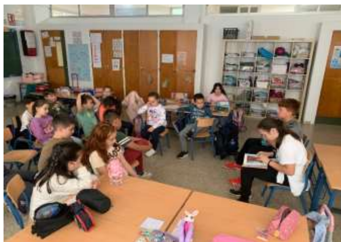
Imagen de una actividad de animación a la lectura, los mayores le leen a los pequeños.